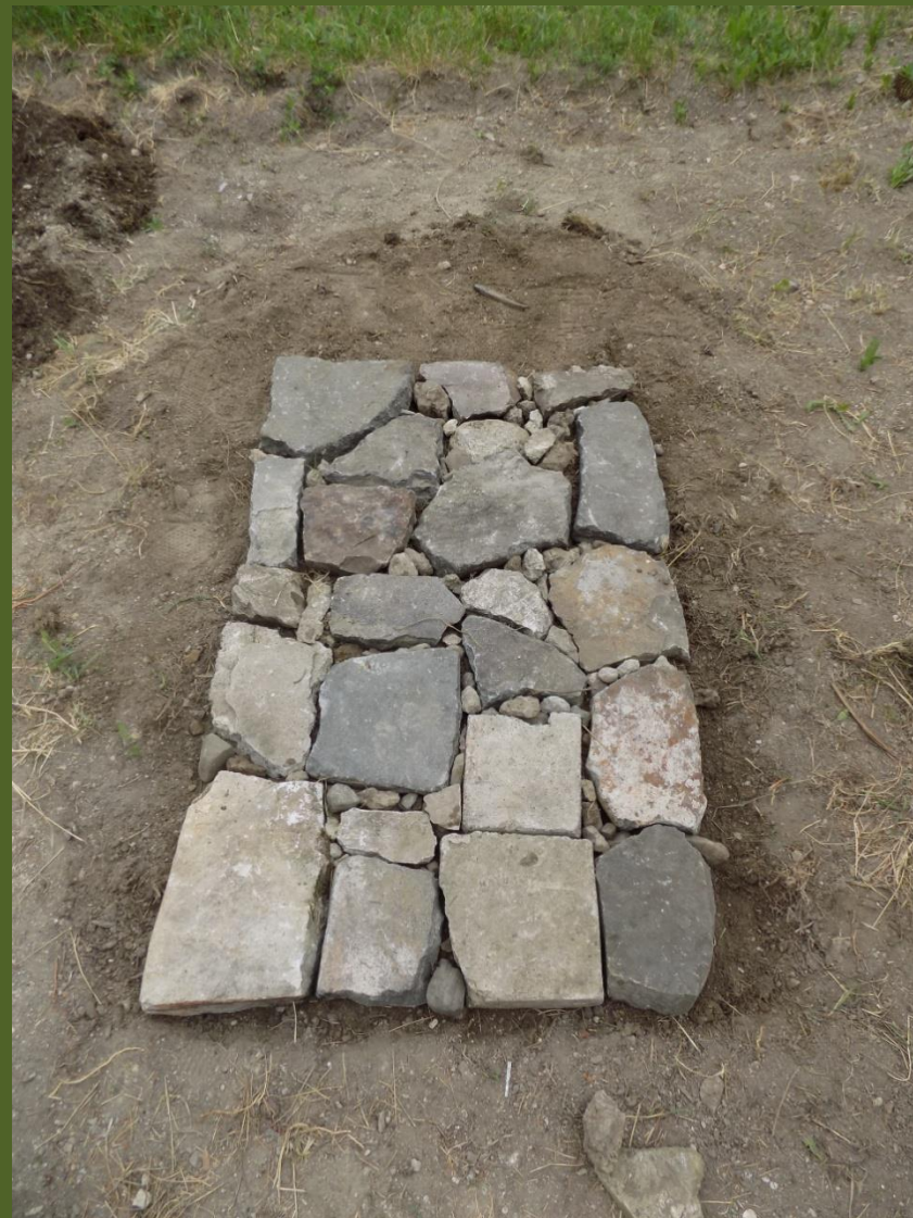
Kemence alapjának a lerakása (eső elleni védelem céljából)