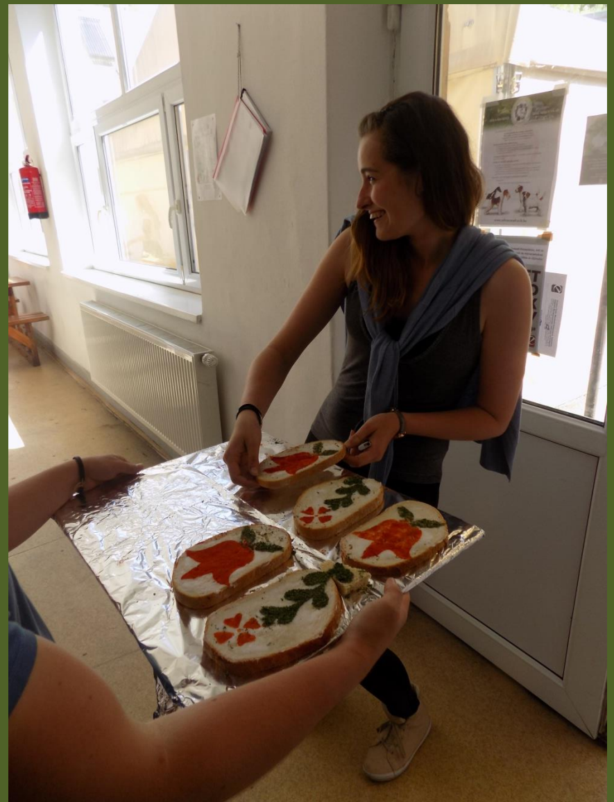
A diákok megvendégelése