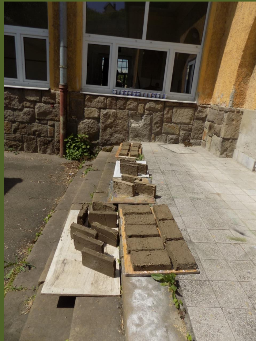
vetőkeret készítés, téglák szárítása az udvaron