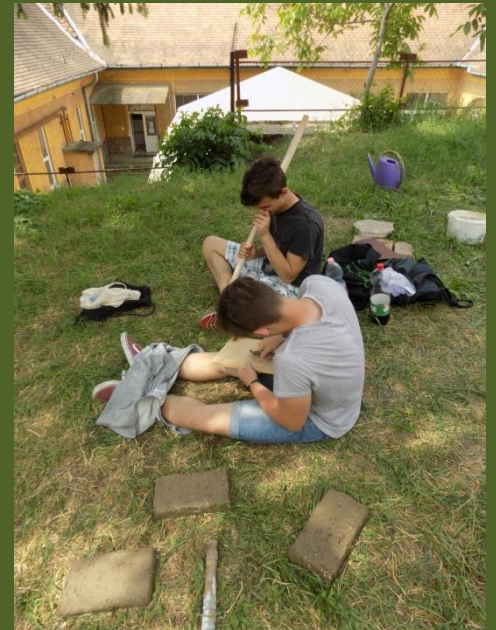
Az építés fázisai